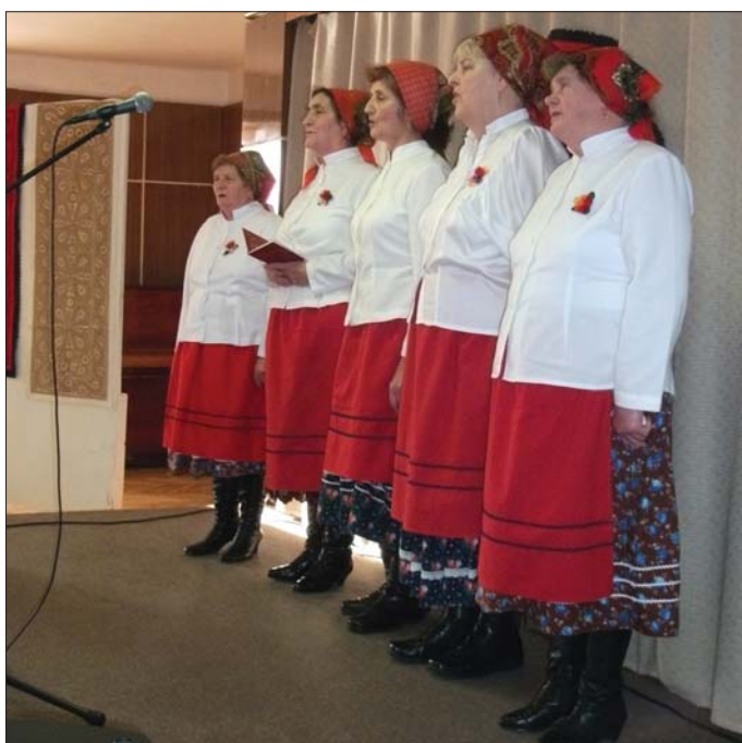
Az Árvácska Népdalkör műsora