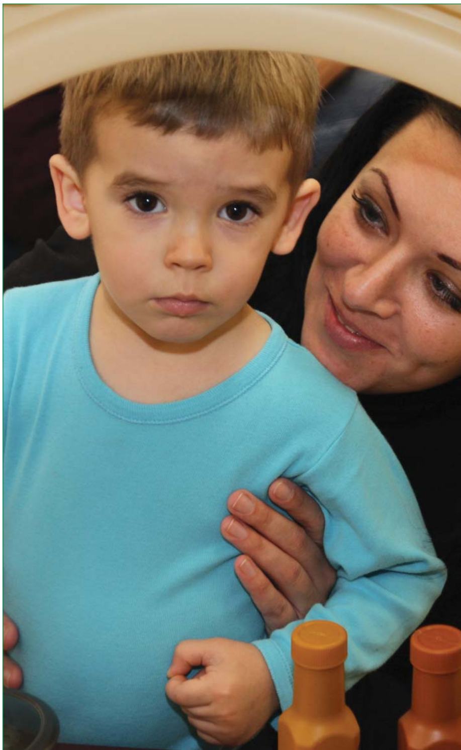
Megnyílt a bölcsődei csoport

2011. január XXII. évfolyam I. szám (237.)