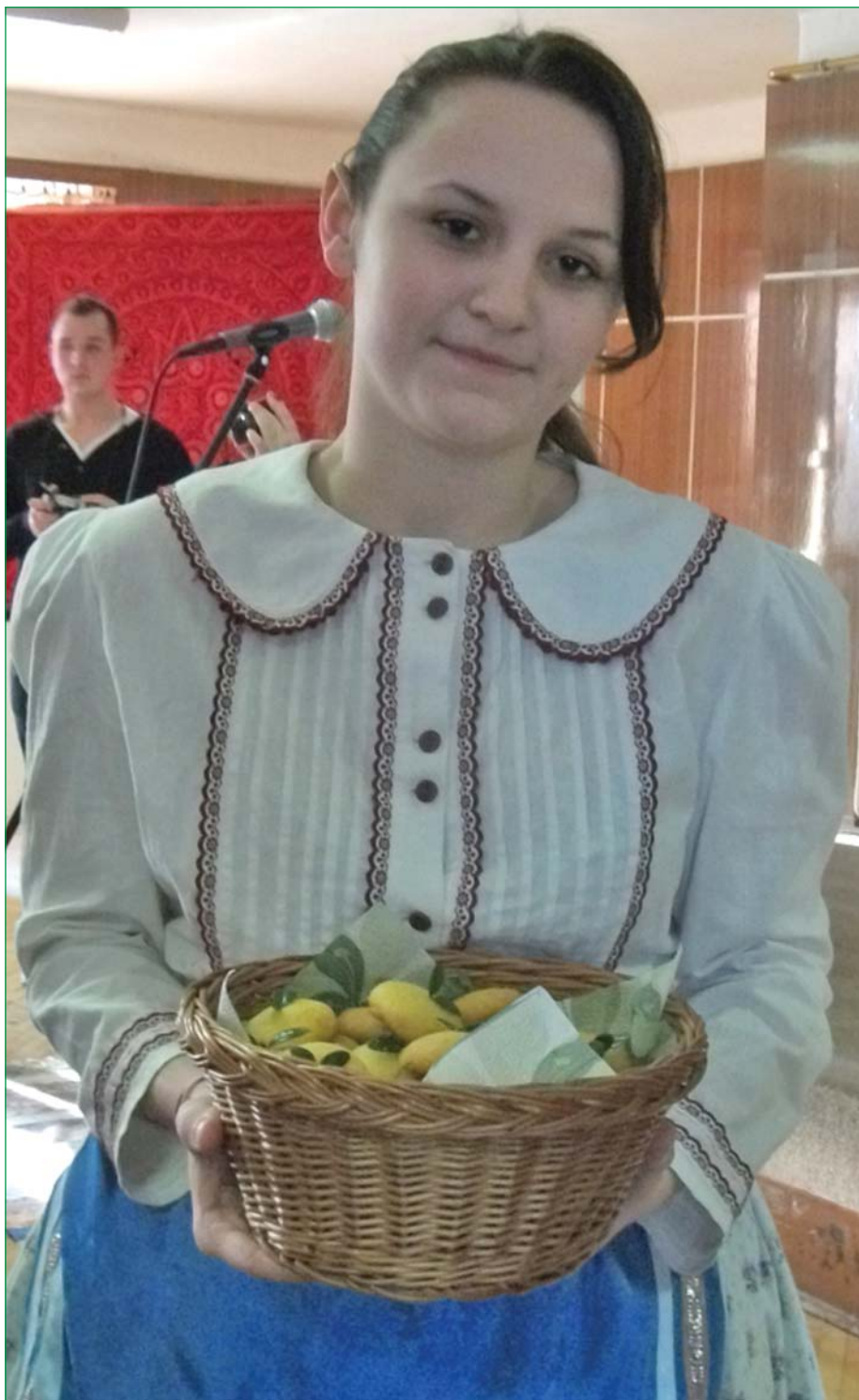
A Magyar Kultúra Napján

2011. február XXII. évfolyam 2. szám (238.)