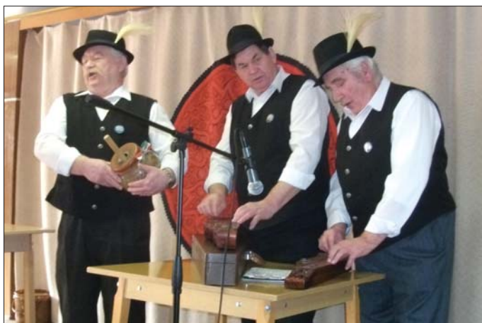
A Tiszavirág Citerazenekar nyitotta a programot