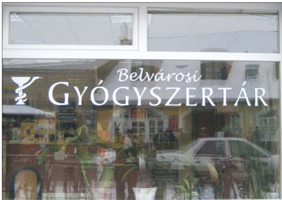
Tőlem 1952-ben államosították az épületet. 1958-ban átépítették, ma ugyancsak ebben az épületben, egy másik helyiségben nyílt ez a patika.