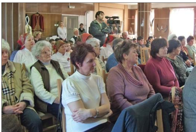
Megtelt a terem az érdeklődőkkel