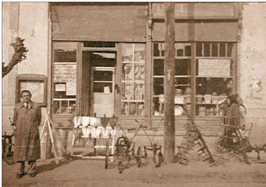
A patika ebben a helyiségben volt, ahol én ezt a vasboltot nyitottam 1948-ban