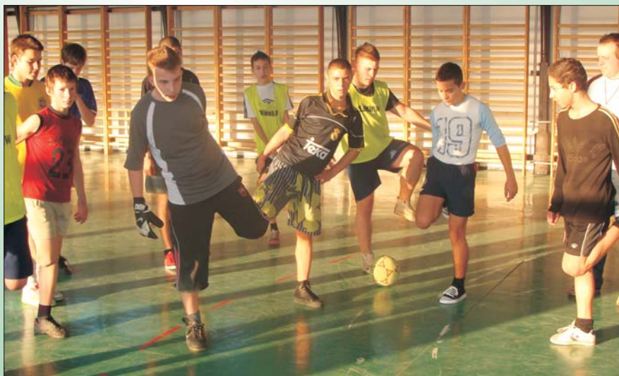
Tornatermi edzésen a serdülő csapat

Minden korosztályos csapattal részt kívánunk venni a felkészülést segítő teremtornákon, illetve felkészülési mérkőzéseken.