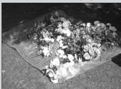
Az eltulajdonított csokor egy része visszakerülhetett az eredeti helyére