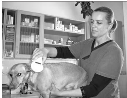
Motyó kutya már megkapta a chipet