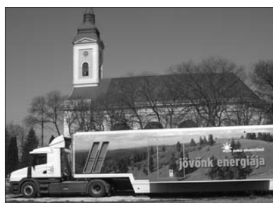
A kamion Polgáron is "leparkolt"

Közép-Szlovákia magyarlakta területeit, köztük Besztercebányát, Rimaszombatot és Kassát is. E három nap alatt meglátogattunk két magyar tannyelvű iskolát is, Ipolybalogon és leendő testvériskolánkban Szepsin. Mindkét intézményben magas színvonalú informatikai felszereltséggel találkozhattunk, és szívélyes fogadtatásban volt részünk. Füleken megtekintettük a Bebek család várát, Szklabonyán látogatást tettünk Mikszáth Kálmán szülőházába, Betlérén pedig