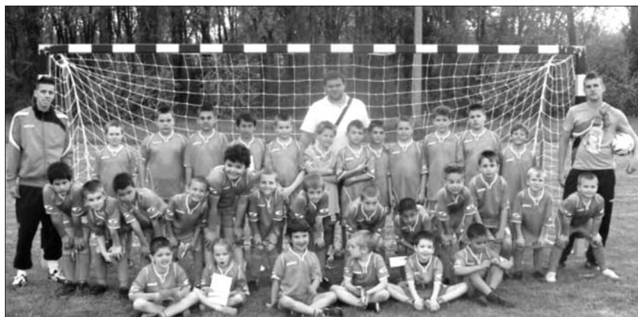
A legkisebbek is részt vettek a legutóbbi utánpótlás tornán

Ifjúsági játékosaink nem igazán tudtak alkalmazkodni a sűrű menetrendhez, és rossz szériával - 4 vereséget szenvedtek -