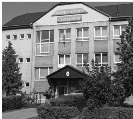
2017-ig minden biztos

„A tankerületben a demográfiai adatokat figyelembevételel 519 fő vesz részt gimnáziumi oktatásban, a férőhely kapacitás 952 fő. A férőhely kihasználtság a két gimnáziumi feladatot ellátó intézményben összesen 54, 52 %, amelyből a hajdúnánási intézmény kihasználtsága 50%, a polgári intézmény kihasználtsága 78%, amely Polgár vonatkozásában eléri az országos átlagot és az elvárt kihasználtsági százalékot. Az iskolában a hátrányos helyzetű tanulók aránya 50%, míg a halmozottan hátrányos helyzetű tanulók aránya 25%. Az intézménybe bejáró tanulók aránya 60%,