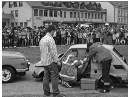
Akcióban a mentést végzők

Ezt személyes indítatásból is mondom, mert én magam is a vöröskereszt szervezte által kezdtem érdeklődni a humán tevékenység, az egészségügy iránt, ami ma is jelen van az életemben.