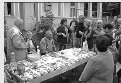
A jó hangulat elmaradhatatlan kelléke a találkozóknak

- Örülök, hogy ilyen összetartó közösség a miénk. Nem csak ilyenkor, főzés alkalmával találkozunk. Segítünk is egymáson, ha munka adódik valakinél, mondjuk a kertben, de ha kell, segítünk szemet, fát, behordani, vagy ápoljuk, látogatjuk, ha beteg valamelyik társunk. Mindnyájan érezzük, hogy tartozunk valahova.