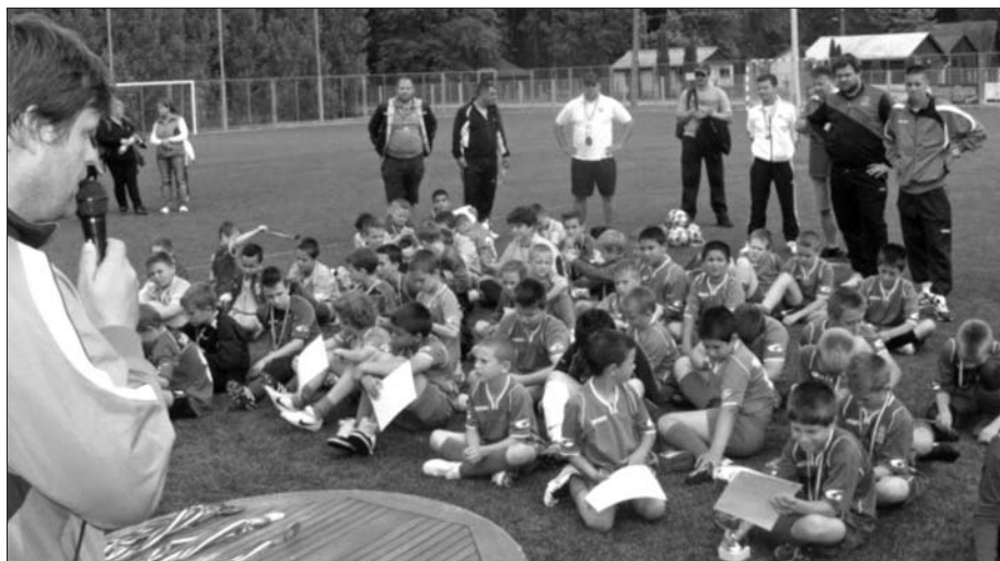
Eredményhirdetés a Polgári Lurkó kupán

Egymást követően négy kirándulás következett, mindenhol tisztes helytállással, az ellenfelek elismerése mellett vagy ellenére, egyéb külső körülmények nem nagyon akarták, hogy több pontot szerezzünk. Szoros mérkőzéseken tisztesen helytállva szenvedtünk egygólós vereségeket, illetve egy győzelmet.