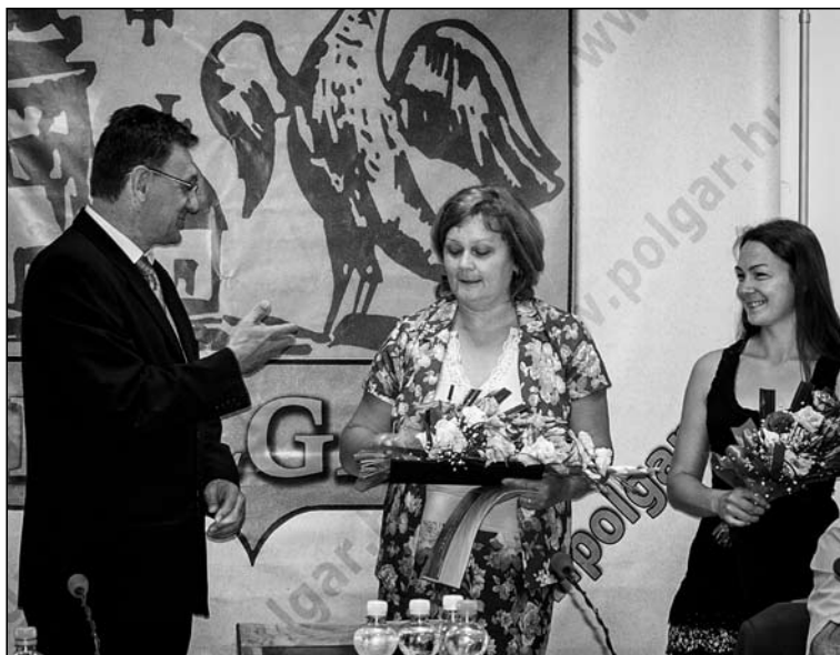
Kupakgyűjtés az óvodáért