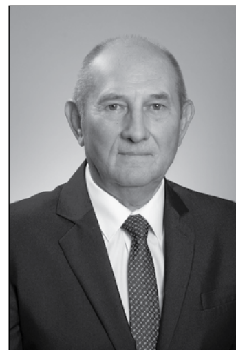
STRUBA JÓZSEF POLGÁRI LOKÁLPATRIÓTA MOZGALOM