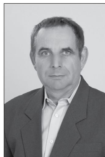
VÁMOSI GYULA JÓZSEF FIDESZ-KDNP