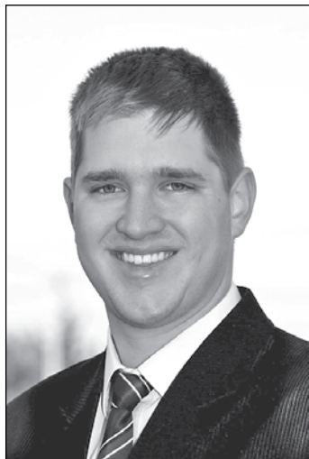
KOVÁ CS MÁTÉ MUNKÁ SPÁ RT