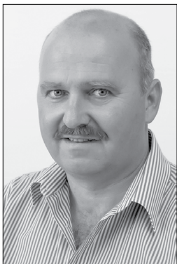
MECSEI DEZSŐ POLGÁRI LOKÁLPATRIÓTA MOZGALOM