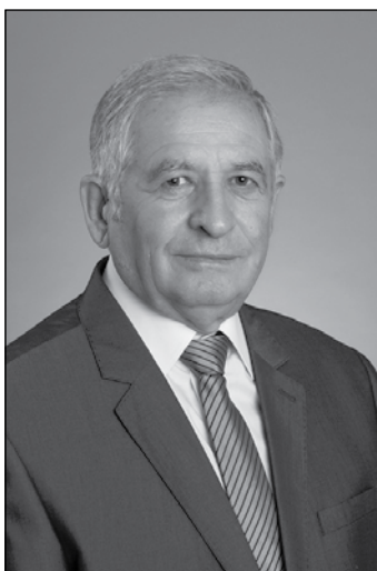
MOLNÁR JÁNOS POLGÁRI LOKÁLPATRIÓTA MOZGALOM