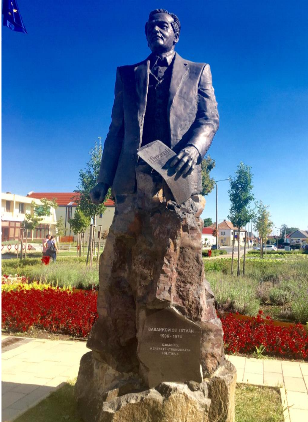
2016. szeptember

Az értéktárba felvételre javasolt helyi érték fényképe vagy audiovizuális- dokumentációja