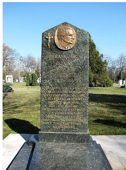
Végső nyughely a Kerepesi temetőben