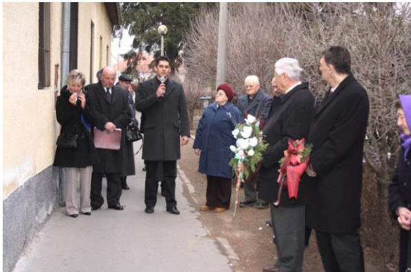
Emléktábla avatás a szülőháznál 1997-ben