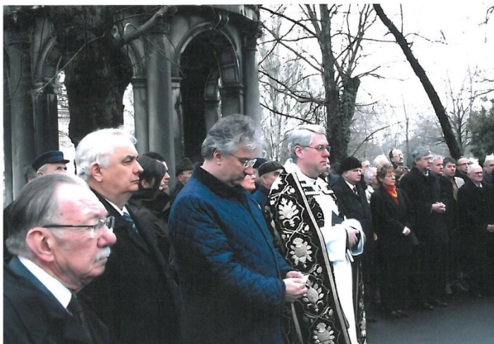
A budapesti gyászszertartás képei a polgári végtisztesség tevőkkel