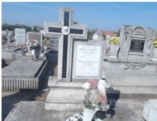
A Barankovics szülők síremléke Polgáron (2016)